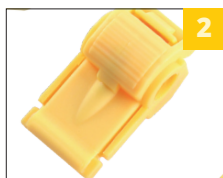
2 пожаробезопасный материал корпуса