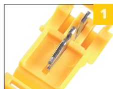
1 латунная контактная группа

Напряжение 450В Материал корпуса полипропилен Материал токоведущих частей латунь