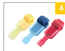
4 3 вида ЗПО под различное сечение провода